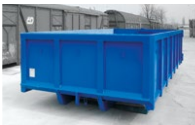
Konstrukcja dla Tatry z dolnym grzbietem.