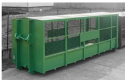
Konstrukcja z siatką i z dachem dwuspadowym.