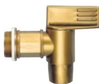
Typ 1280 2" pripojovací rozmer