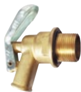
Typ 7005 3/4" pripojovací rozmer