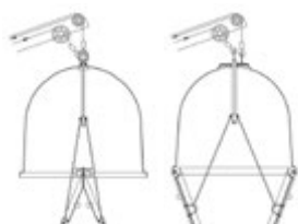
◀ Systémy vyprázdňovania

Pri výbere farebného variantu veka sa za kód výrobu pripája kód farby. Napríklad 6780-4 pre žltú a pod.